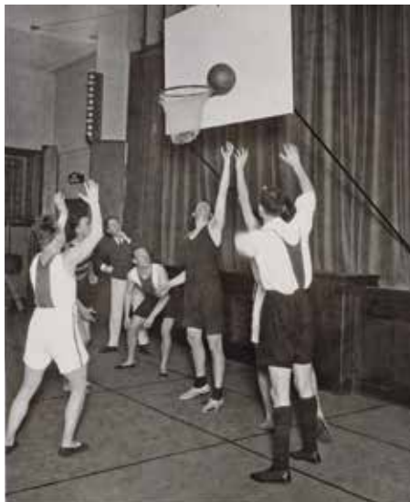
Demonstratiewedstrijd in het AMJV-gebouw. Verenigde Fotobureaux N.V., 1930, Stadsarchief Amsterdam

In deze begintijd werd basketbal beschouwd als een leuke wintertraining