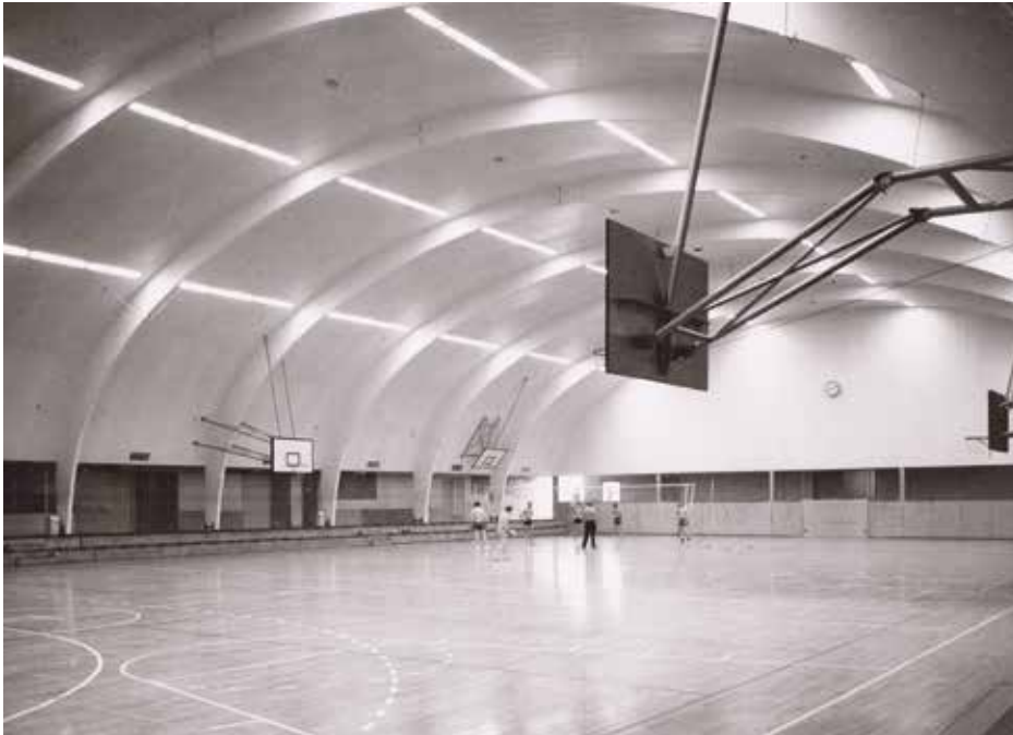
De sporthal aan de Van Hogendorpstraat. J.M. Arsath Ro'is, 1969, Stadsarchief Amsterdam

Twintig jaar na de Bevrijding kwam in Amsterdam de eerste sporthal. Eindelijk kreeg de sport weer aandacht van de autoriteiten.