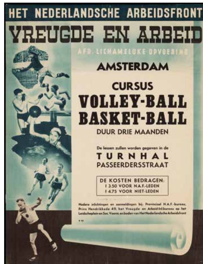
Affiche van het Nederlandsche Arbeidsfront, afdeling Lichamelijke Opvoeding, waarop basketbal wordt aangeprezen. Onbekende maker, 1944

Het AMVJ-pand was meteen na de inval gevorderd door de Duitse oorlogsmachine. In juni 1940 kwam daar het Luftgaukommando , de facilitaire dienst van de