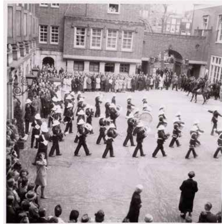
Bevrijdingsfeesten met het Canadees Muziekkorps bij het gemeentehuis. Onbekende fotograaf, 1945, Stadsarchief Amsterdam

In diezelfde tijd speelden de Rotterdamse basketballers eindelijk eens bovengronds. Op 10 juni was er een toernooi met een Amsterdamse ploeg en een Canadese ploeg, waarbij het wederom onbekend is met welke spelers. Dat is jammer, want volgens Het Vrije Volk hebben die solda-