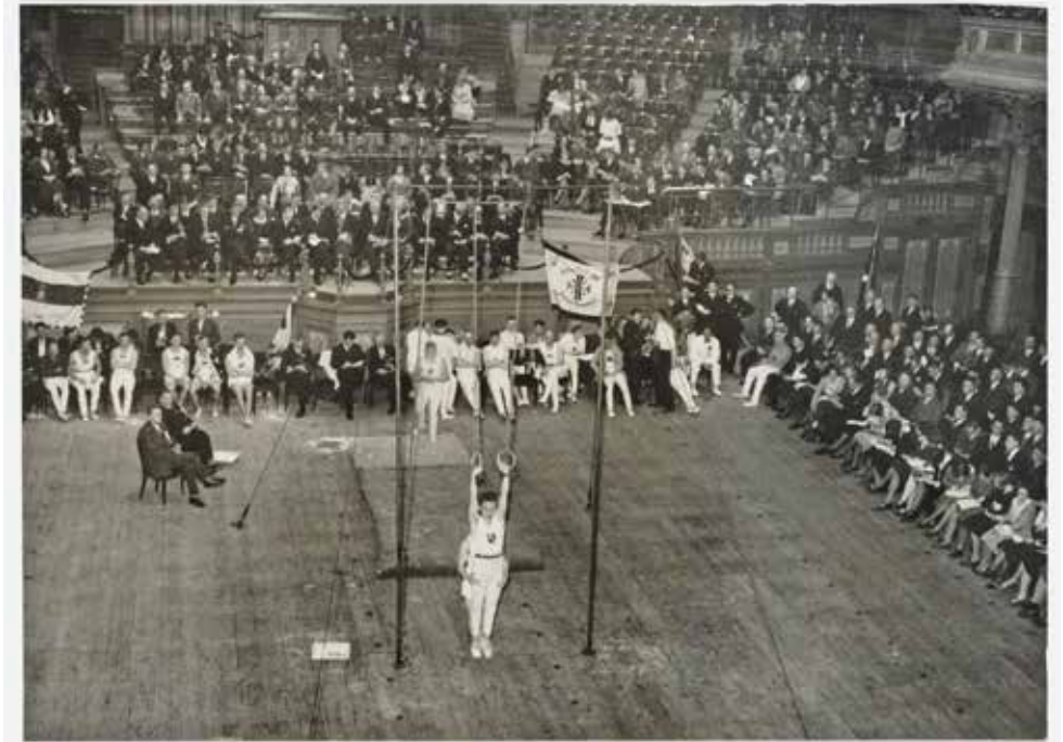
Turnwedstrijden in het Concertgebouw. Van de basketbalwedstrijden in het Concertgebouw zijn geen foto's bekend. 1930

Het basketbal was wederom de afsluiter, ditmaal met een Belgische tegenstander. Tegen de Brusselse Athletic Club speelde