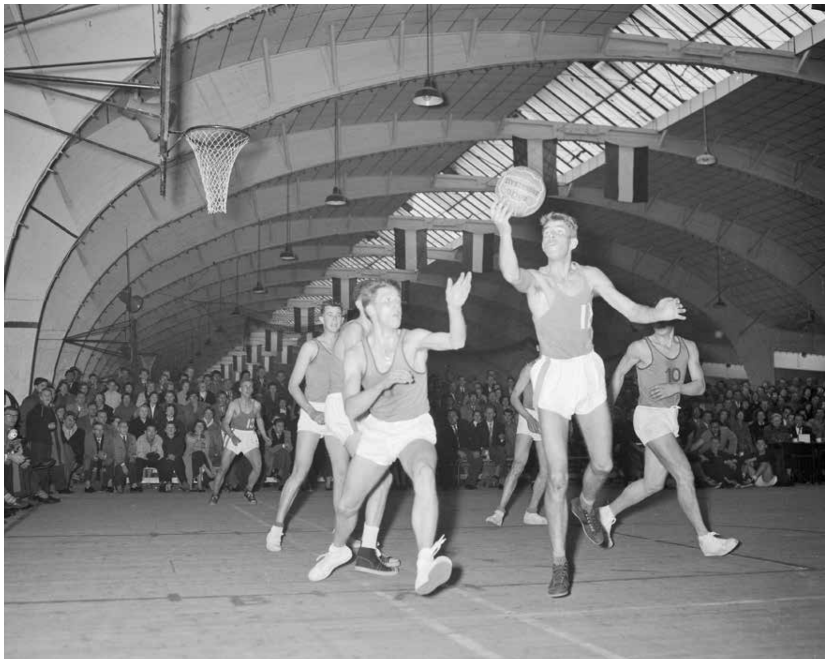
Wedstrijd van Nederland tegen Luxemburg in de Apollohal, die beslist zou worden met 43-58.

1956