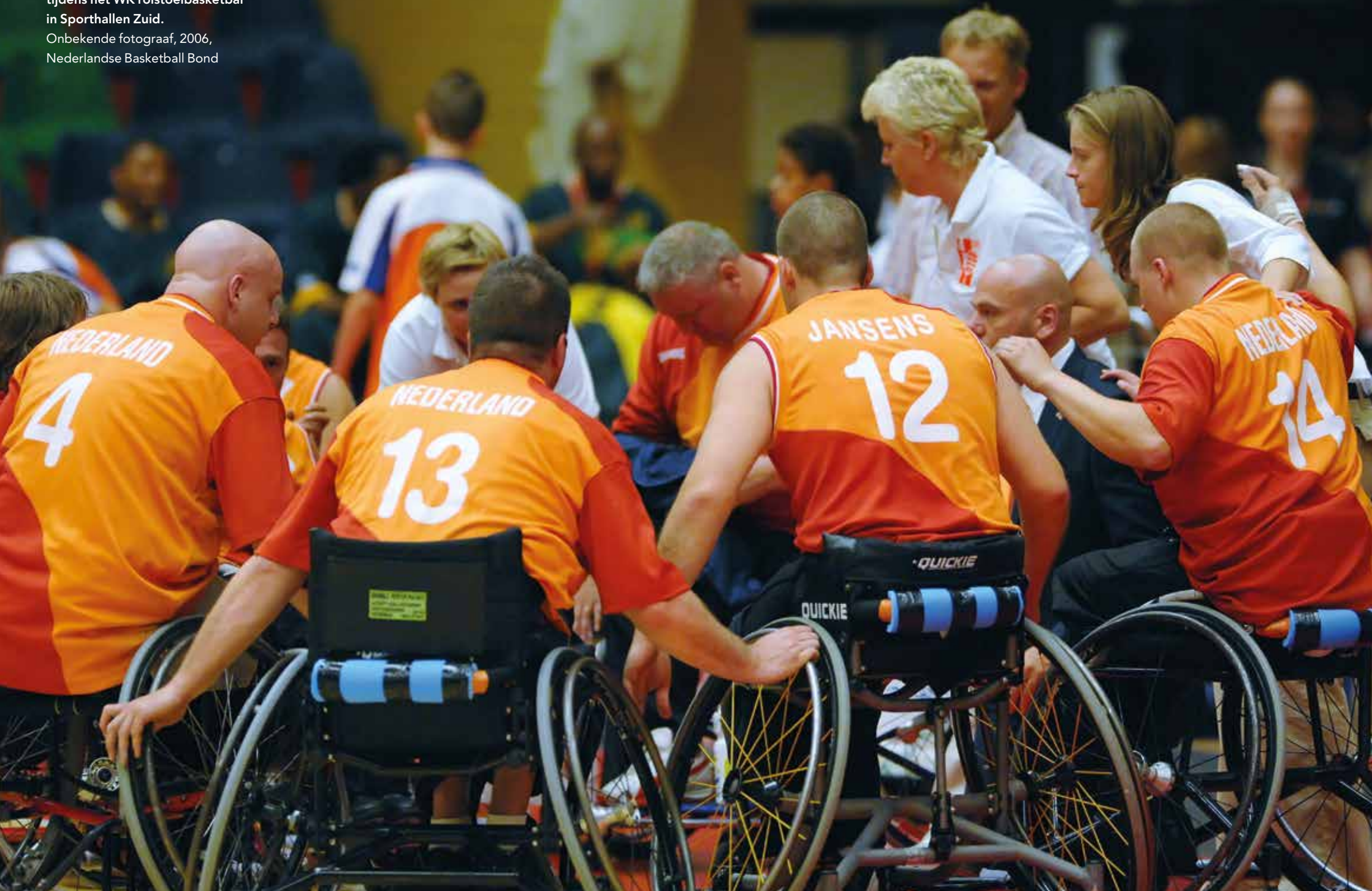
Het Nederlandse team in overleg tijdens het WK rolstoelbasketbal in Sporthallen Zuid. Onbekende fotograaf, 2006, Nederlandse Basketball Bond