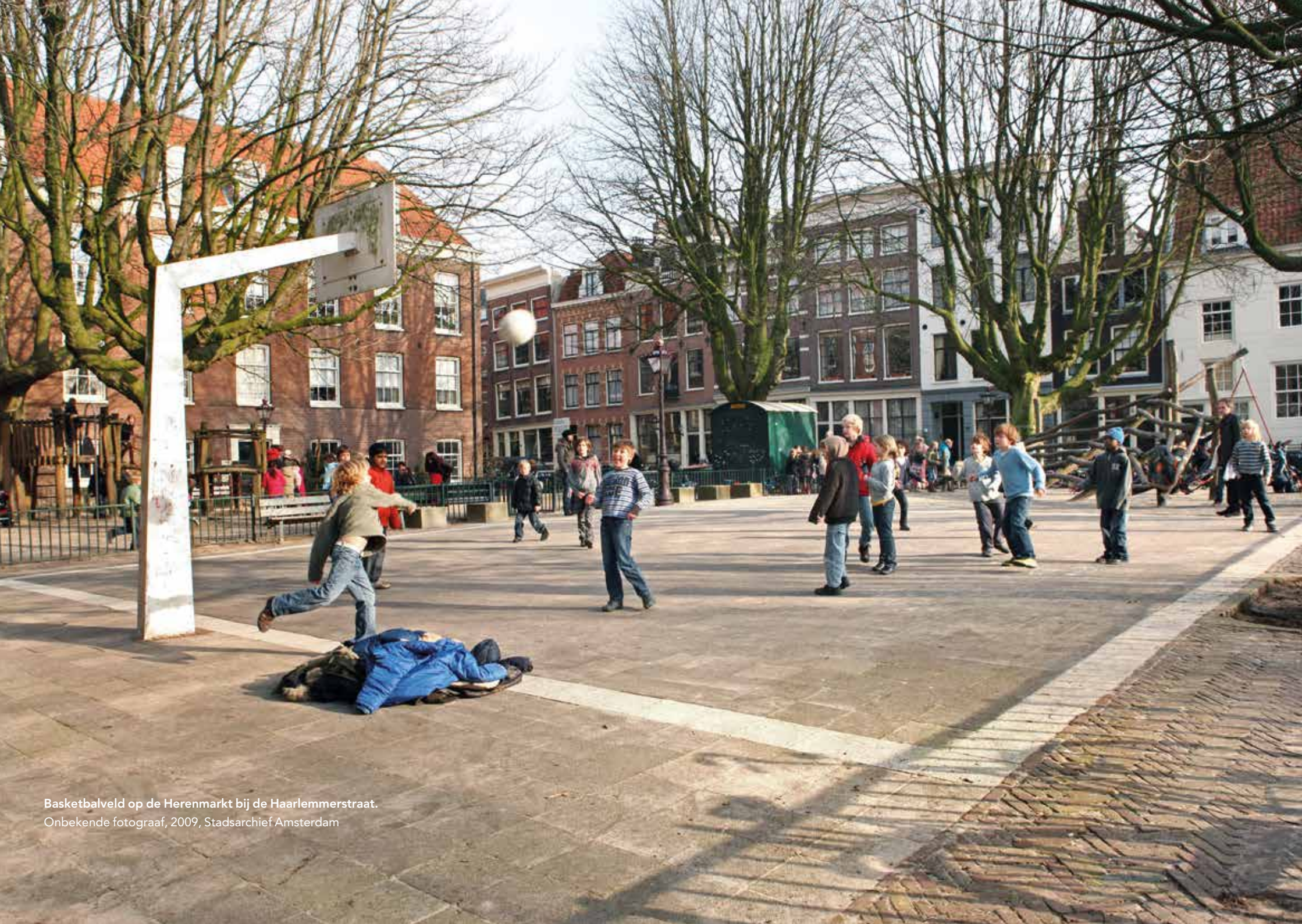
Basketbalveld op de Herenmarkt bij de Haarlemmerstraat. Onbekende fotograaf, 2009, Stadsarchief Amsterdam