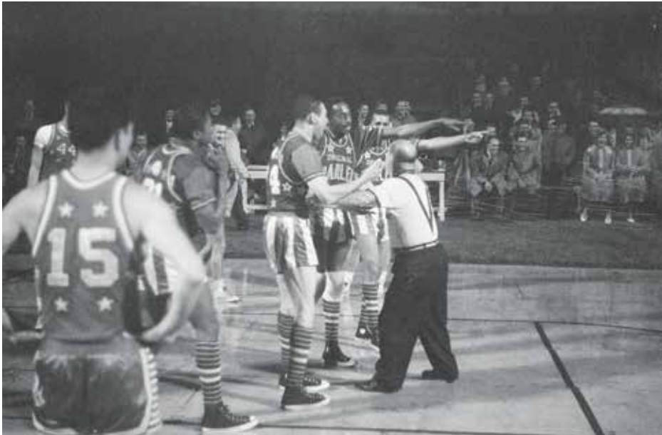
The Harlem Globetrotters in het Olympisch Stadion. Dave Brinkman/Anefo, 1961, Nationaal Archief

The Harlem Globetrotters speelden in 1951 voor de eerste keer in Amsterdam. Dat was in het Olympisch Stadion, nog in de openlucht.