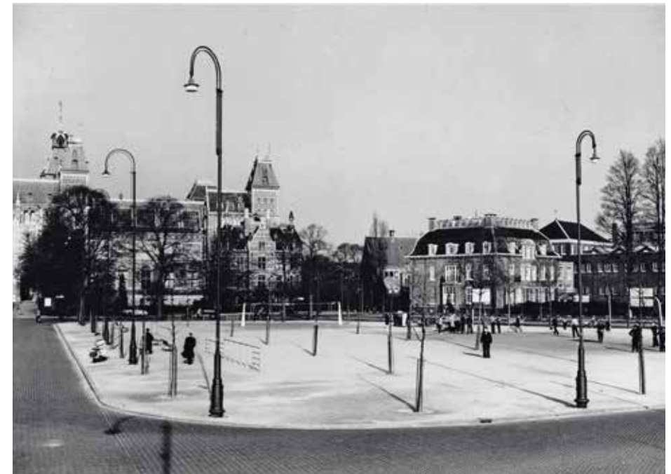
Het basketbal- en volleybalveld op het Museumplein met links het Rijksmuseum. G.L.W. Oppenheim, 1957, Stadsarchief Amsterdam

In 2019 is er nog steeds basketbal op het Museumplein. Precies 65 jaar na de opening van dit veld is juist daar het WK 3x3 basketbal, op de plek waar het basketbal voor de eerste keer de buitenlucht opzocht.