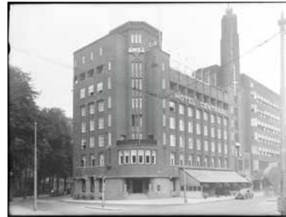
Hoofdingang van het verenigingsgebouw van de Amsterdamsche Maatschappij voor Jongemannen aan de Stadhouderskade.

Onbekende fotograaf, 1928, Stadsarchief Amsterdam