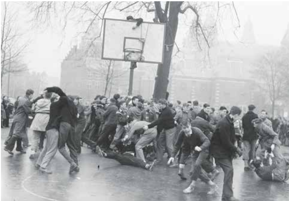
Het FAMOS-toernooi eindigt in tumult onder middelbare scholieren.

FAMOS, wat voor veel scholieren de eerste kennismaking is geweest. Het was nog wel de kleinste sport, want aan de FAMOS Sportweek van 1937 deden maar 25 basketballers mee. Het enthousiasme was aanzienlijk groter dan de kennis van de spelregels. 'Met gevolg', zo schreef Het Algemeen Handelsblad , 'dat het spel meermalen zeer veel overeenkomst had met rugby'.