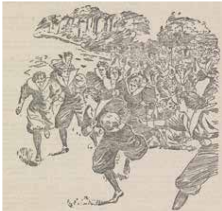
Spotprent op het vrouwenbasketbal in de Verenigde Staten. Onbekende maker, 1896