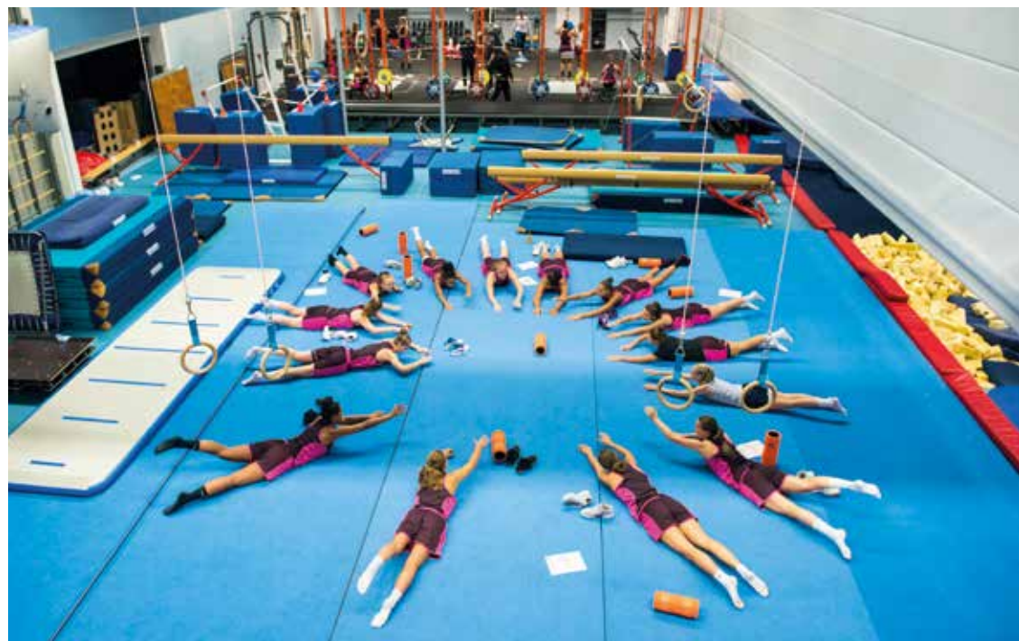
Training van de Orange Angels in de Ookmeerhal in Nieuw-West.

In 2018 kwam er in Amsterdam ook een CTO voor de mannelijke basketballers: de Orange Lions Academy met talenten van vijftien tot en met twintig jaar oud. Net als bij de vrouwen is Topsport Amsterdam verantwoordelijk voor de begeleiding, waarbij meteen wordt gelet op de combinatie van topsport en onderwijs, de duale carrière.