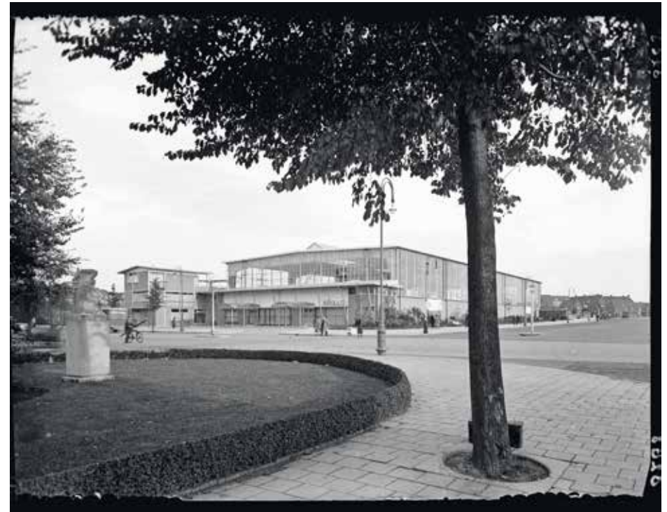
De Apollohal, gezien vanaf de Apollolaan.

Al snel na de officiële opening bleek de Apollohal vanwege zijn omvang uitermate geschikt voor massabijeenkomsten,