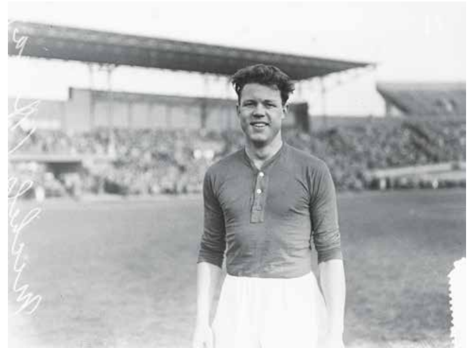
Rinus Michels op het voetbalveld in het Olympisch Stadion. 1954

Vijf jaar later speelde Michels nog steeds in Amsterdam, maar inmiddels voor basketbalclub Herly. En met succes, want in maart 1952 werd hij opgenomen in het Amsterdamse jeugdteam.