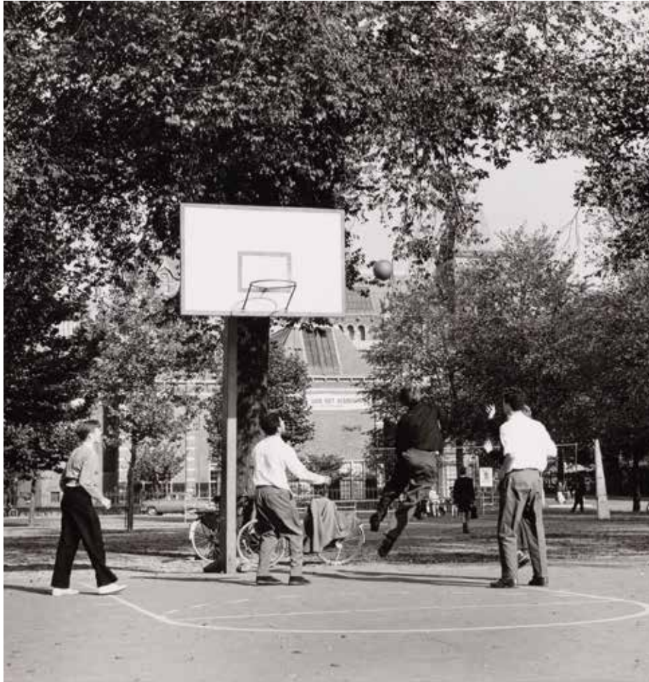
Basketbal op het Museumplein. 1955