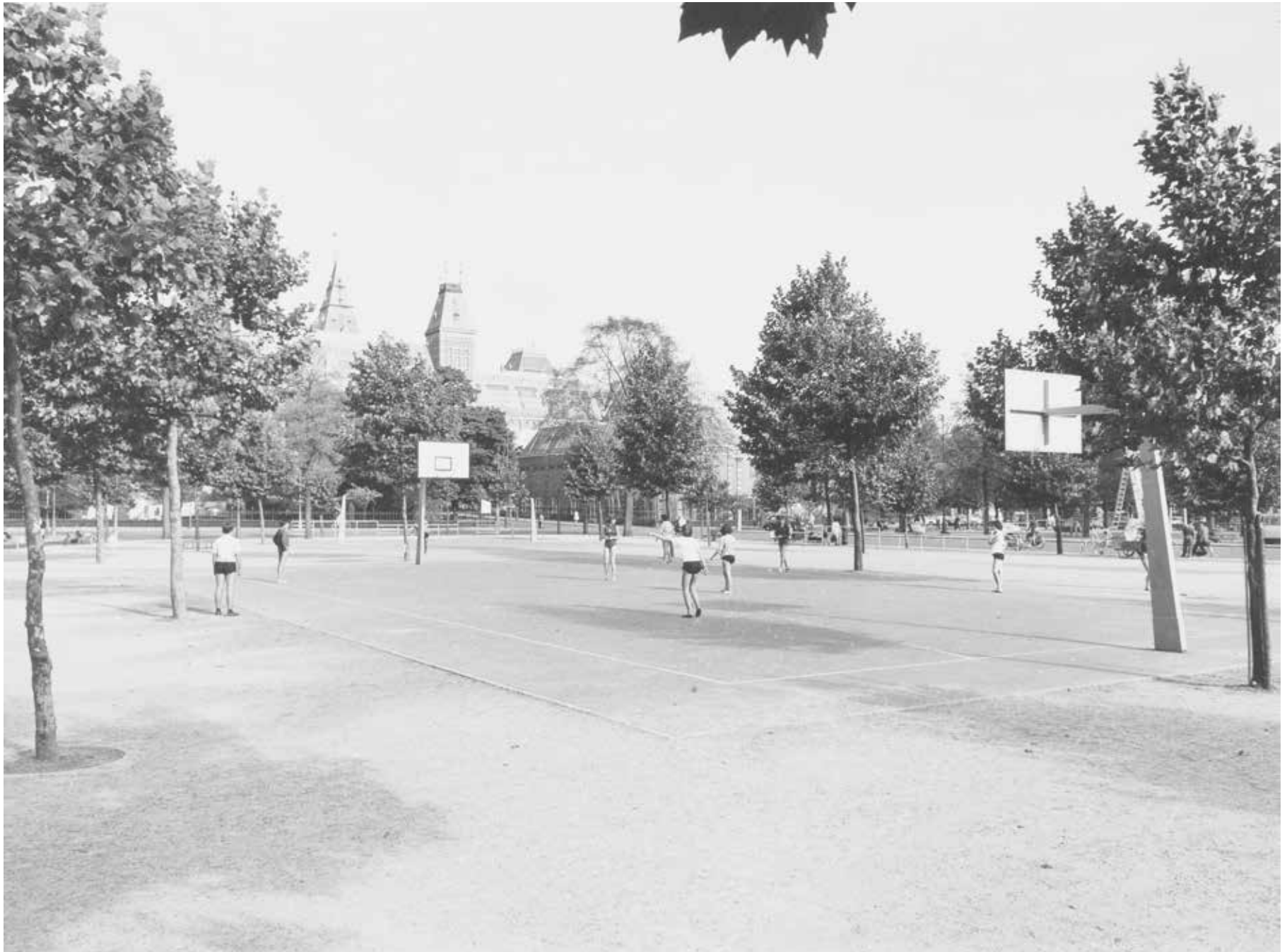
Basketbal op het Museumplein met op de achtergrond het Rijksmuseum. Onbekende fotograaf, 1959, Stadsarchief Amsterdam